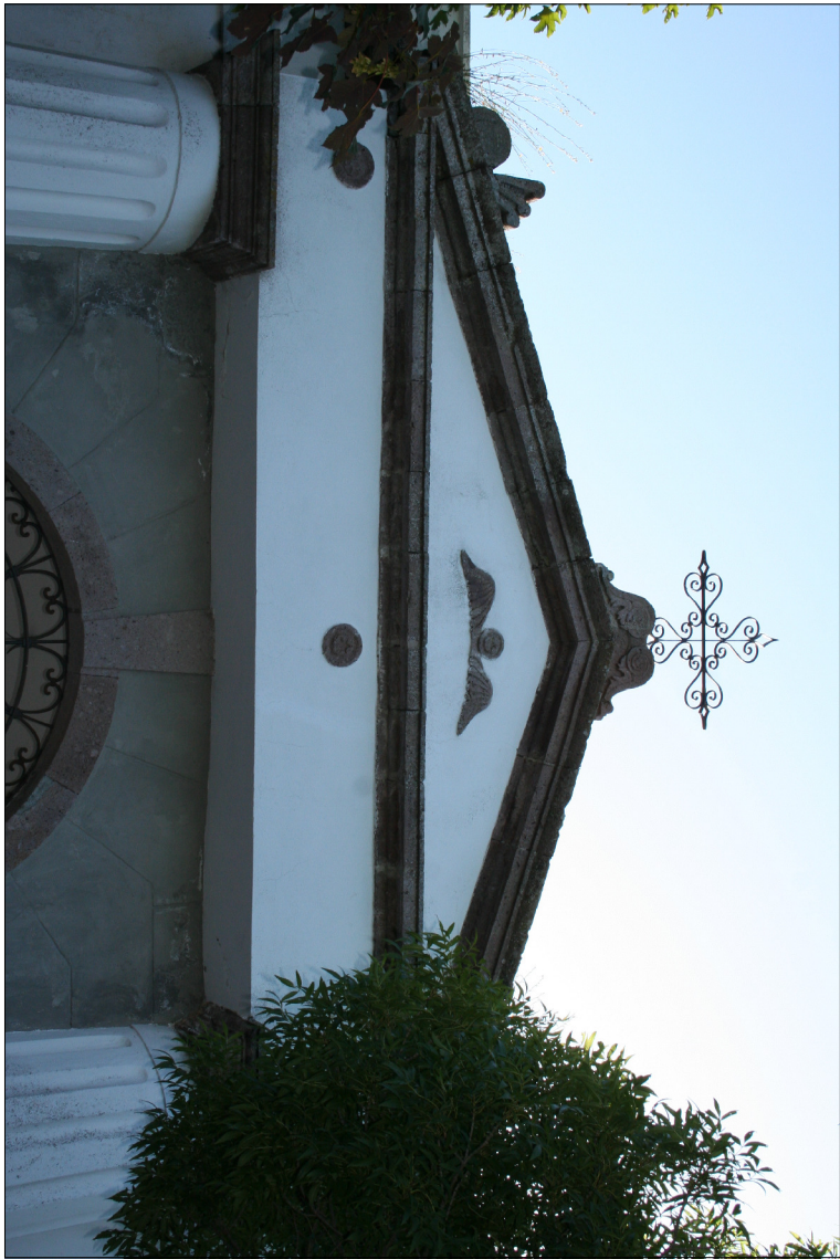
1 - Portale monumentale Prospetto verso il centro abitato