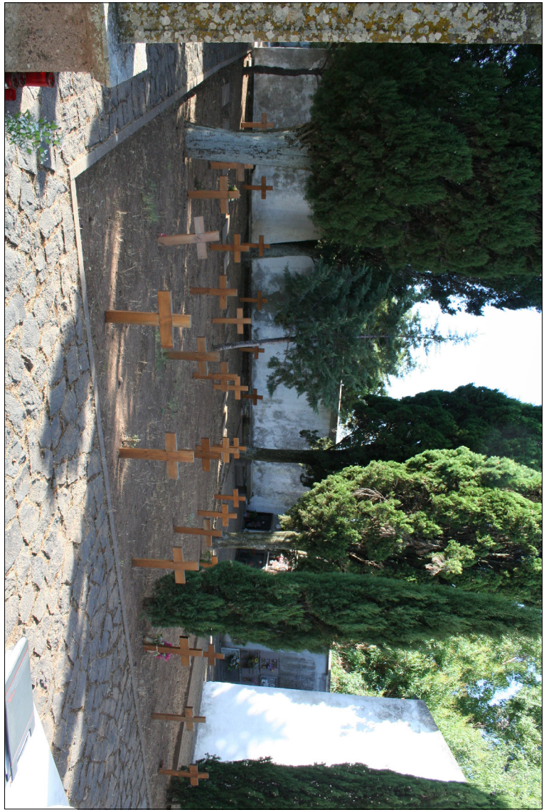
Vista di insieme con tumuli delle sepolture