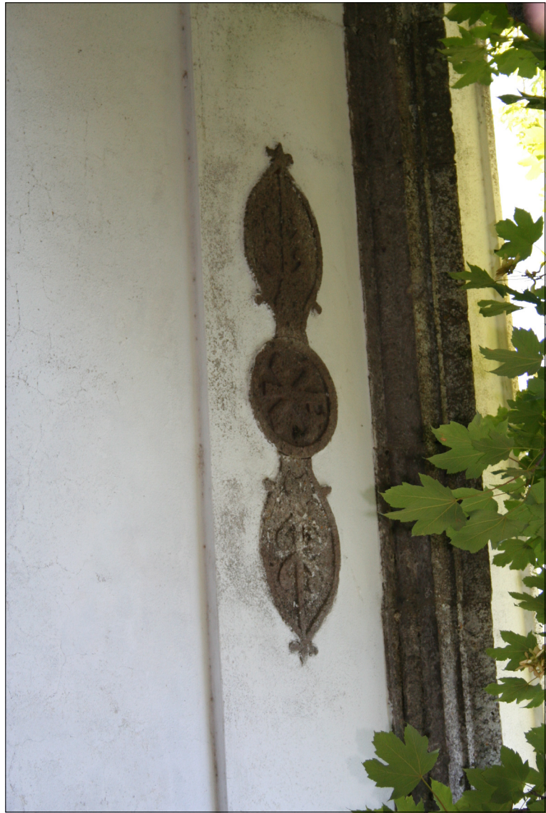
2 - Elementi monumentali Elementi decorativi sotto il cornicione