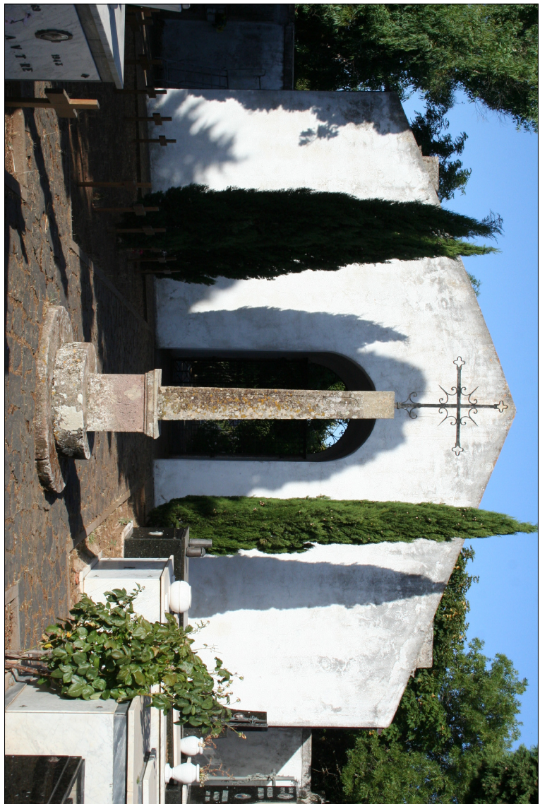
5 - Croce all'incrocio dei viali principali Vista verso il portale monumentale