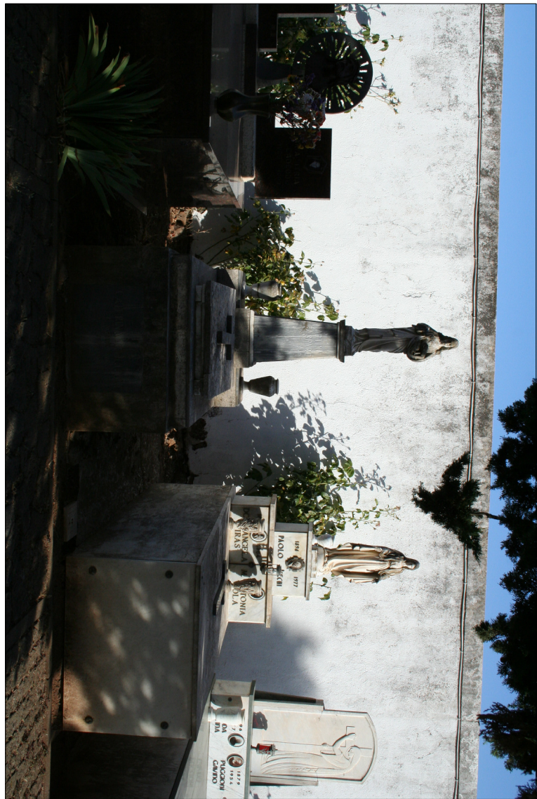
3 - Tumulazione nel Campo II Visto di insieme del cimitero