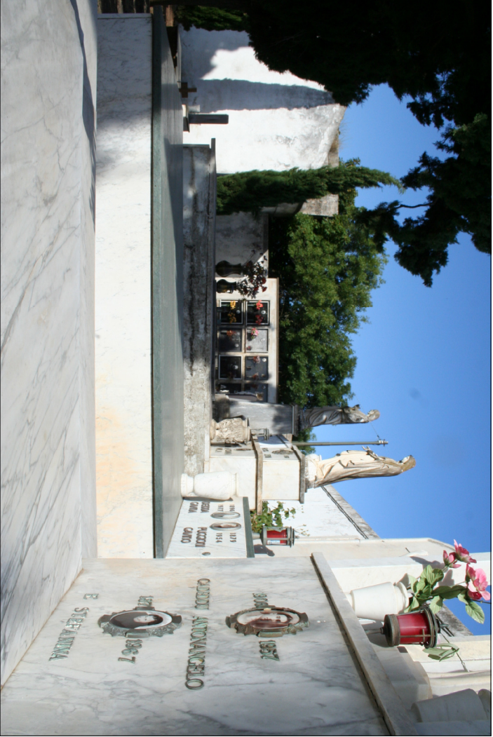
2 - Visuali interne al cimitero antico Campi IV e III - Funerari e sarcofagi verso il muro di cinta