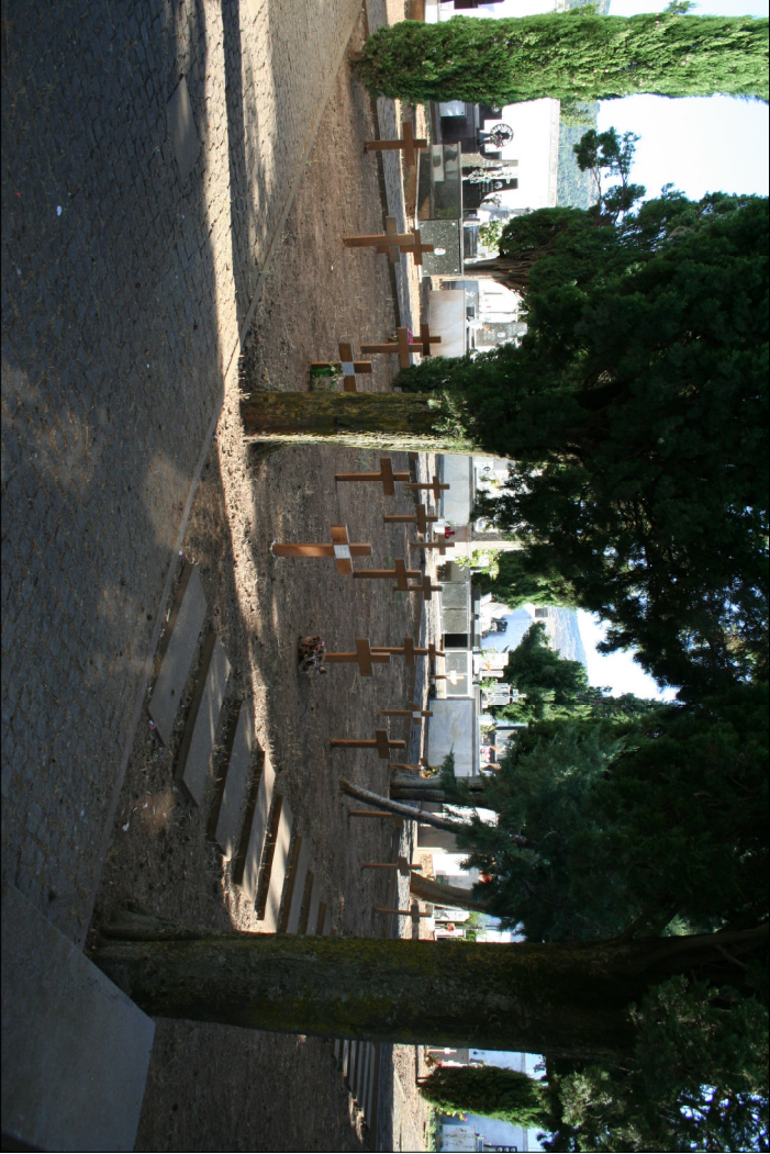
2 - Visuali interne al cimitero antico Campo I