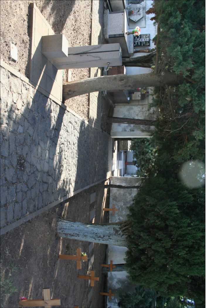
2 - Visuali interne al cimitero antico Campi I e II - Valle verso il nuovo cimitero