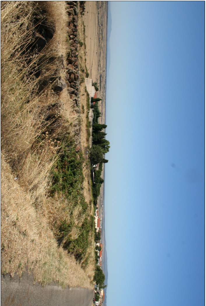
1 - Visuali esterne al cimitero Visuale del cimitero con il limite del centro abitato