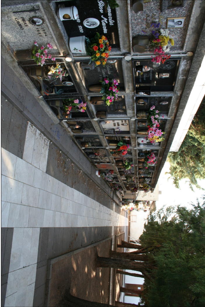
3 - Visuali interne al nuovo cimitero Riga 1 - Loculi