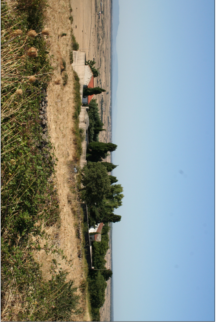
1 - Visuali esterne al cimitero Visuale verso valle