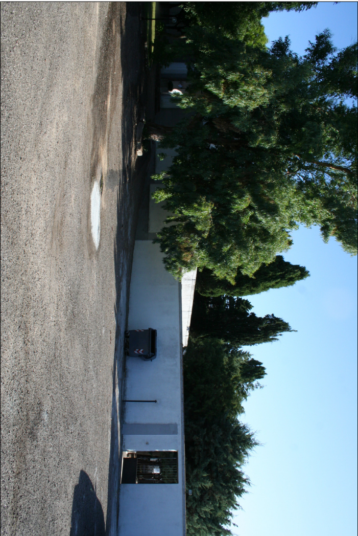
1 - Visuali esterne al cimitero Muro di cinta con l'ingresso al nuovo cimitero