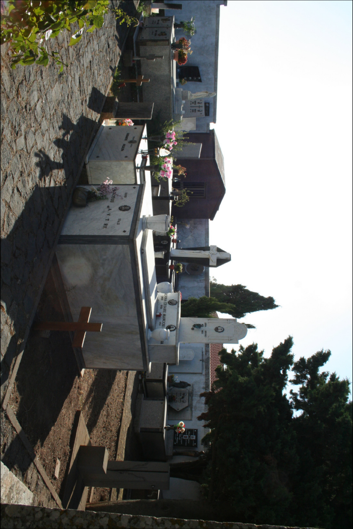
2 - Visuali interne al cimitero antico Campo II