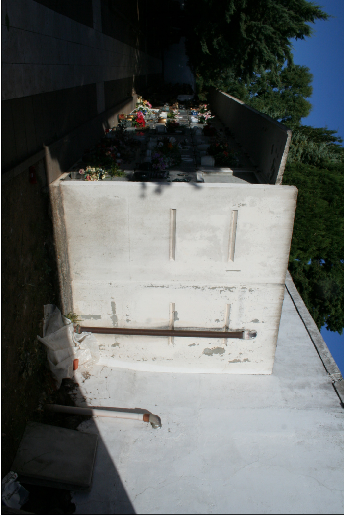
3 - Visuali interne al nuovo cimitero Riga 1 - Muro di contenimento tra i due cimiteri e loculi