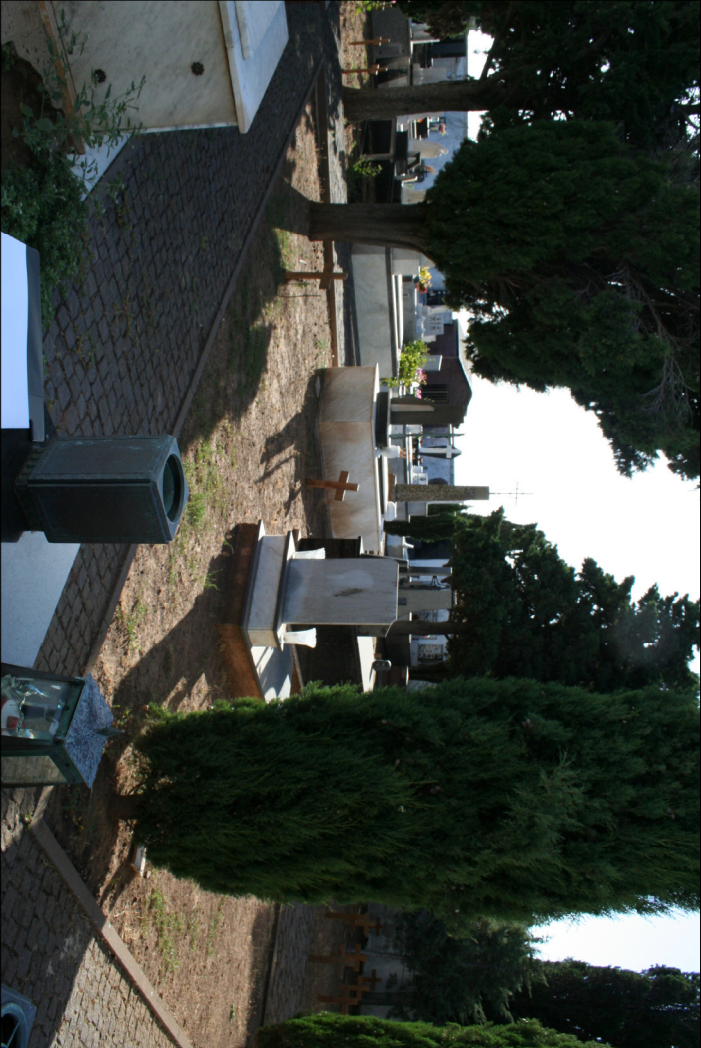
2 - Visuali interne al cimitero antico Campo III