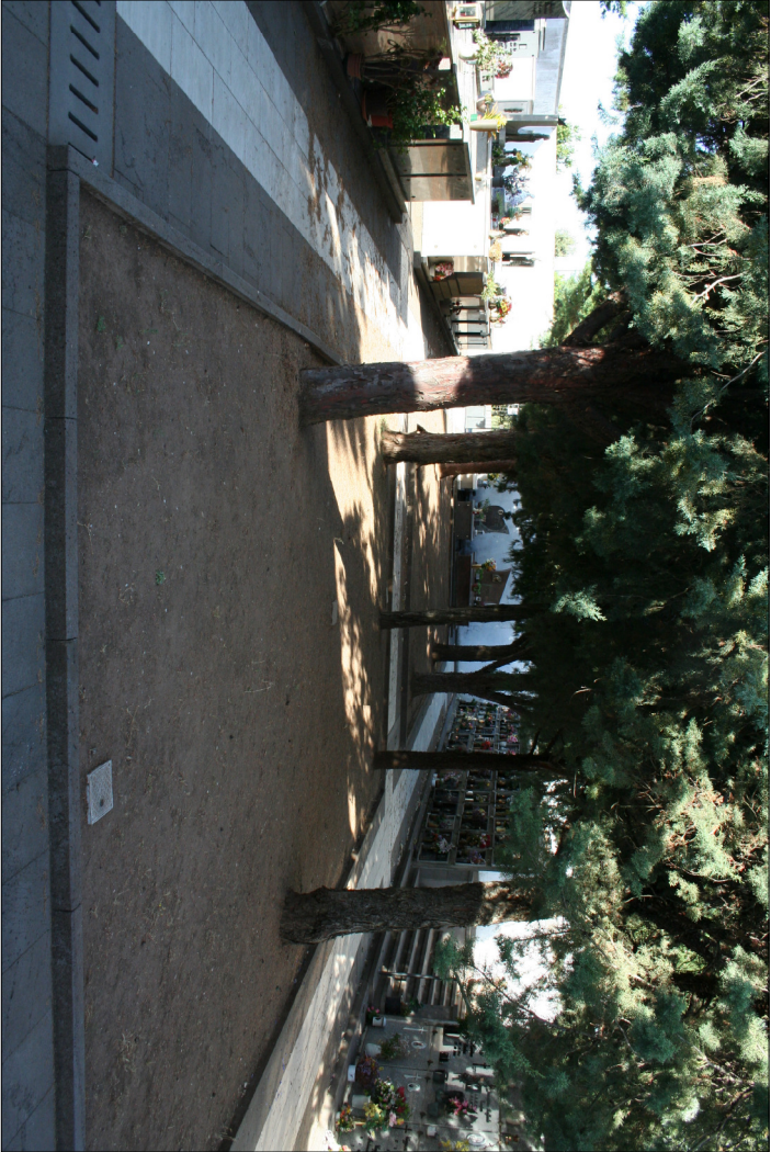
3 - Visuali interne al nuovo cimitero Riga 2 - Visuale verso l'ingresso al nuovo cimitero