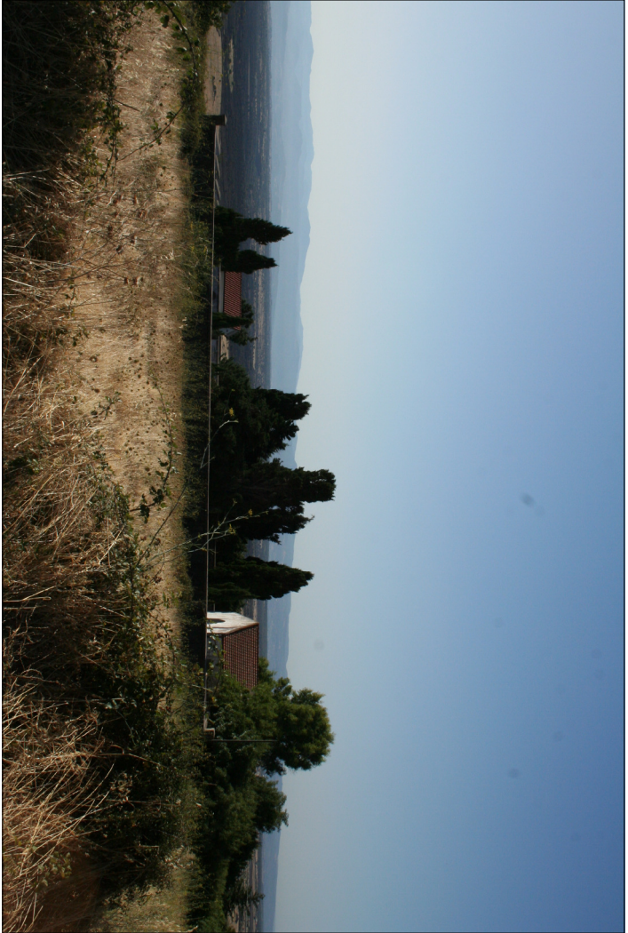
1 - Visuali esterne al cimitero Visuale verso il cimitero antico