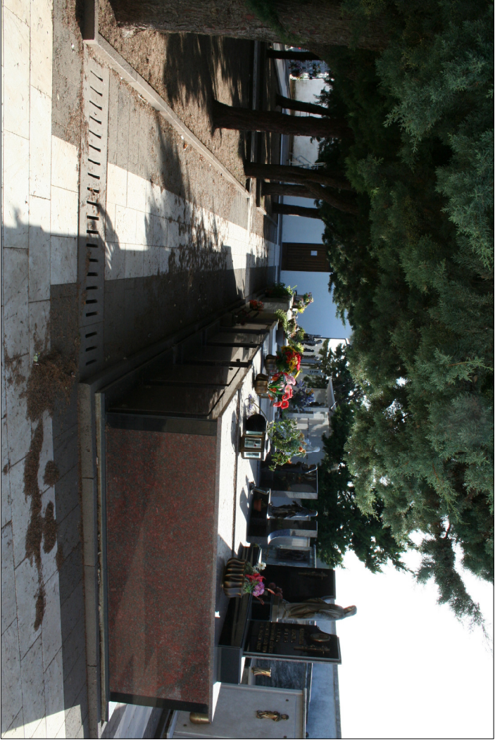
3 - Visuali interne al nuovo cimitero Riga 3 - Funerari e sarcofagi verso la cappella