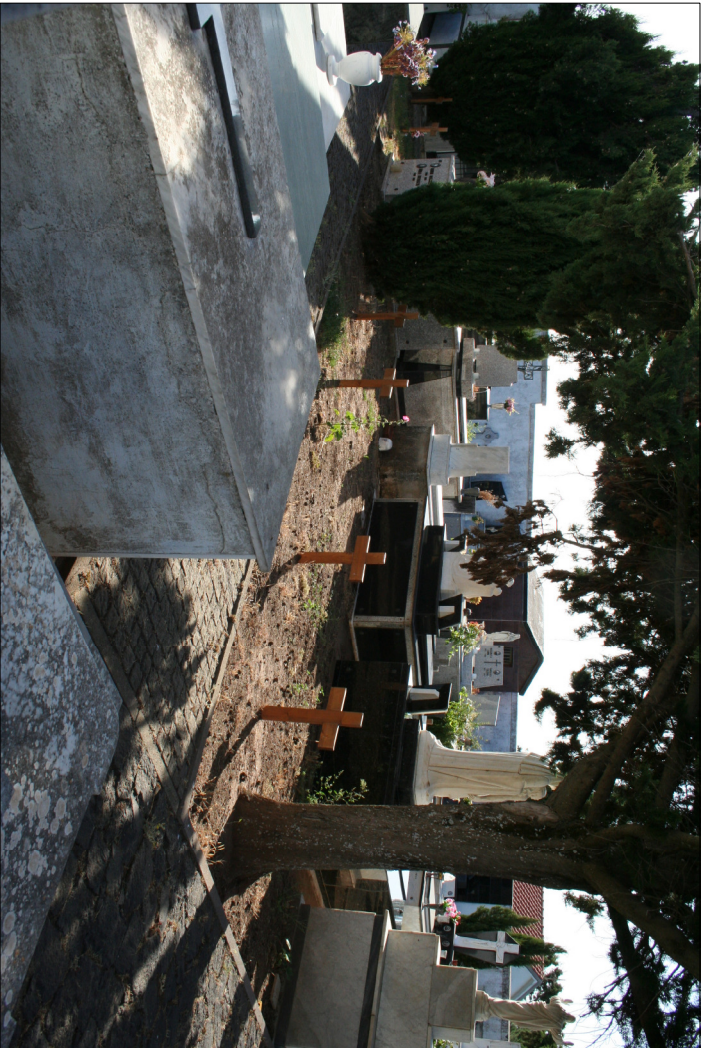
2 - Visuali interne al cimitero antico Campo IV