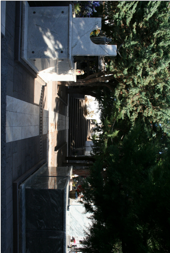
3 - Visuali interne al nuovo cimitero Riga 3 - Valle verso il cimitero antico