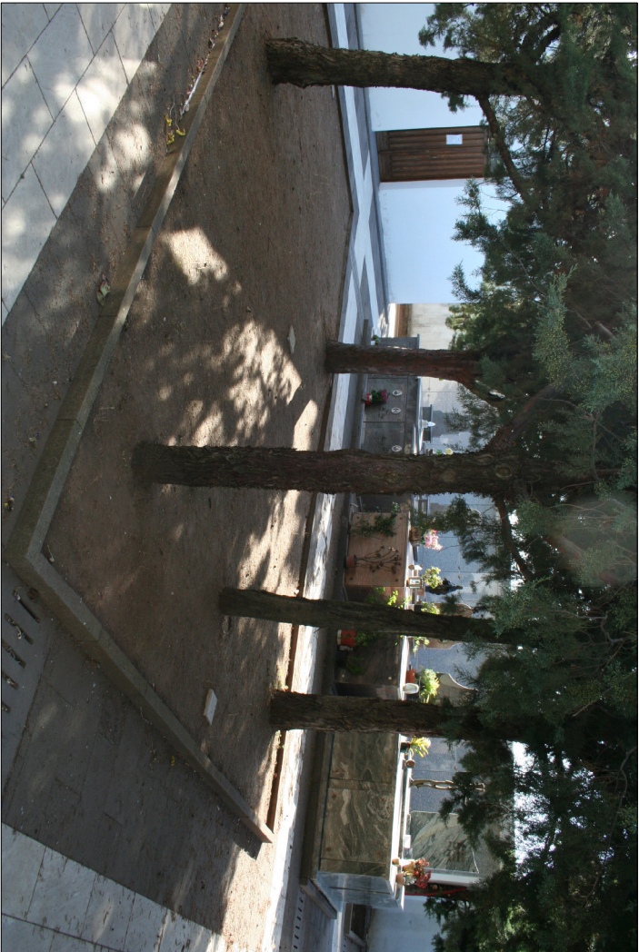
3 - Visuali interne al nuovo cimitero Riga 2 - Visuale verso la cappella