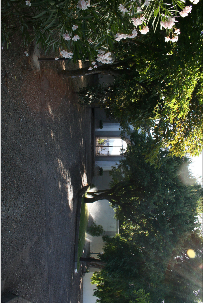
1 - Visuali esterne al cimitero Visuale del cimitero con il ingresso al cimitero antico