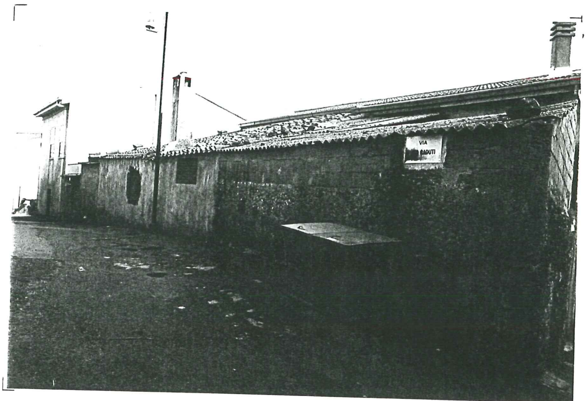
PROSPETTO SU VIA DEI CADUTI - unità a - b