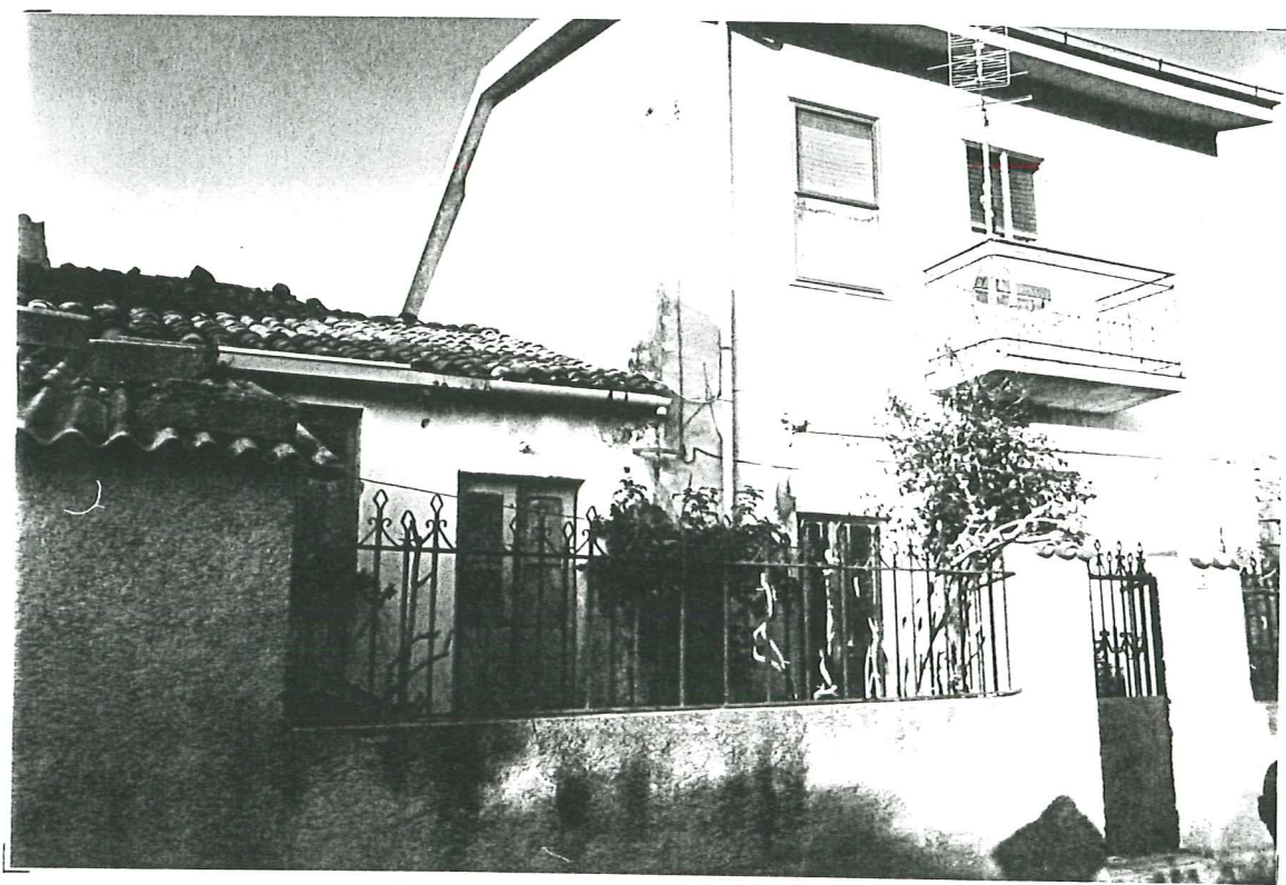
PROSPETTO SU VIA LEONE XIII - unità b