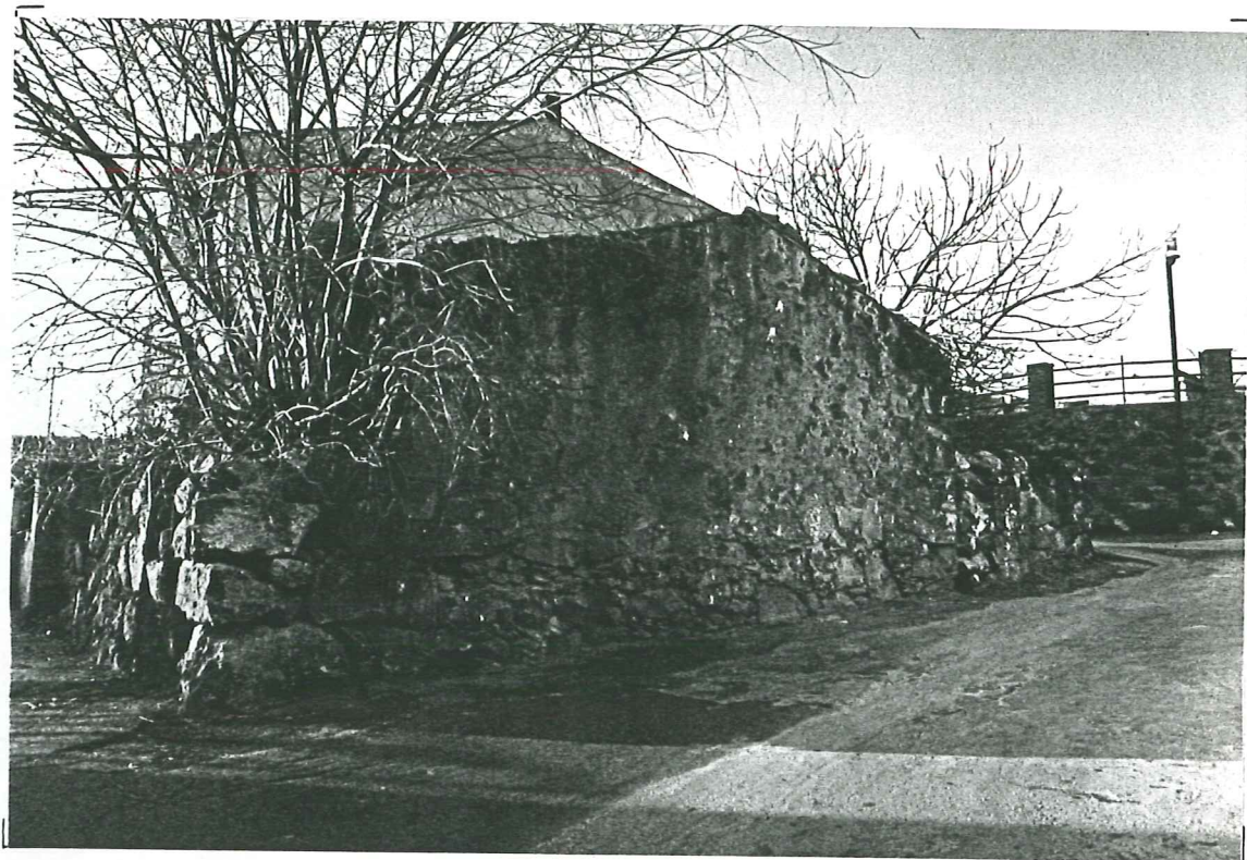
PROSPETTO SU VICO DEI CADUTI - unità c