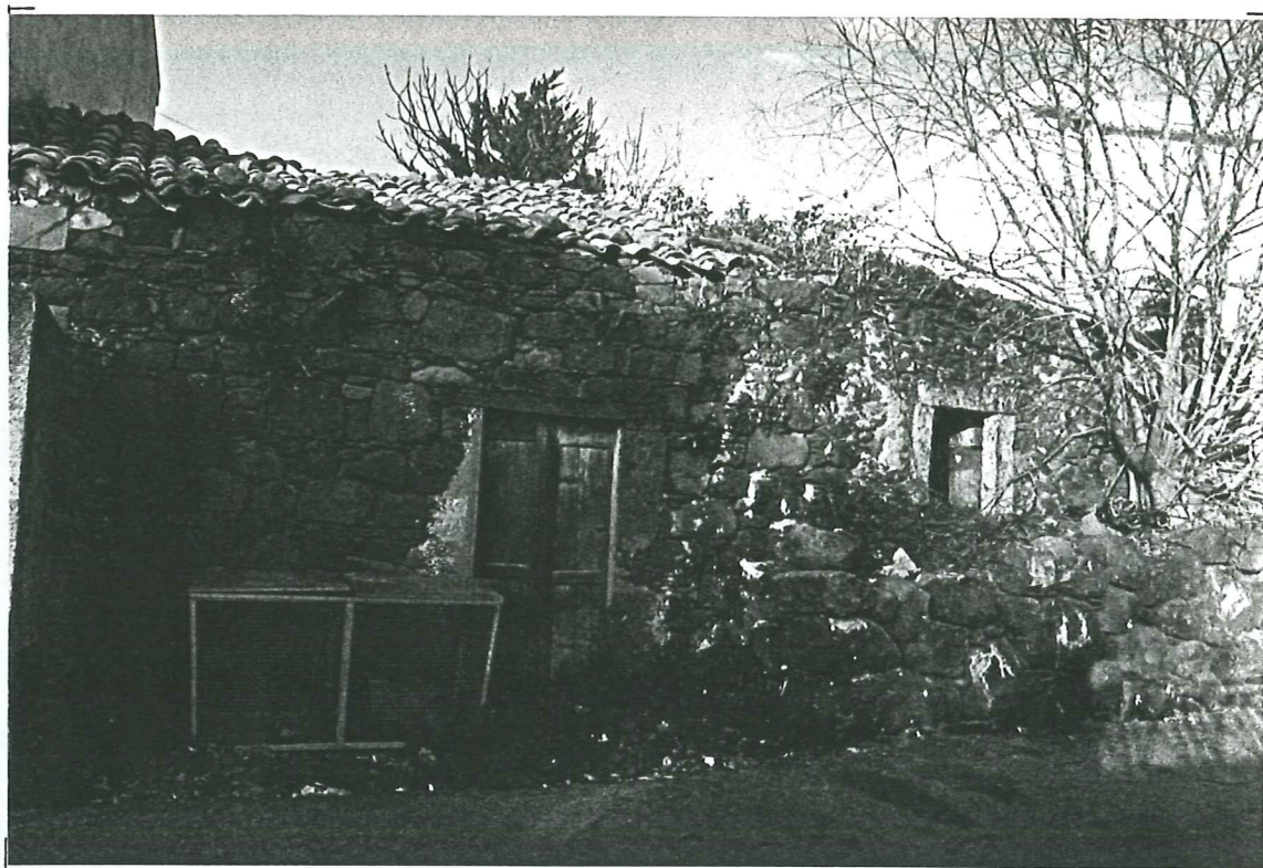
PROSPETTO SU VIA LEONE XIII - unità c