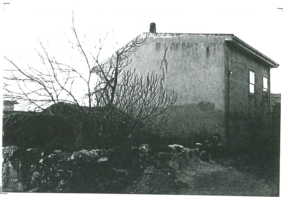
PROSPETTO SU VIA DEI CADUTI - unità c - b