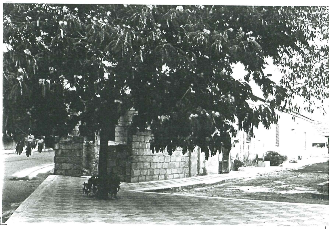
PROSPETTO SU PIAZZA IV NOVEMBRE unità a