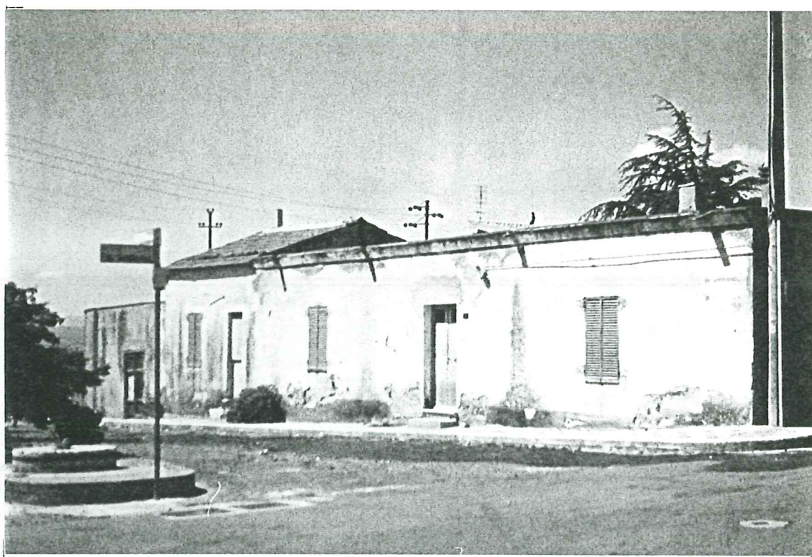
PROSPETTO SU VIA IV NOVEMBRE unità a