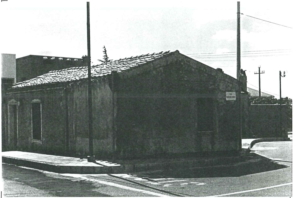
PROSPETTO SU VIA S. ANDREA unità b