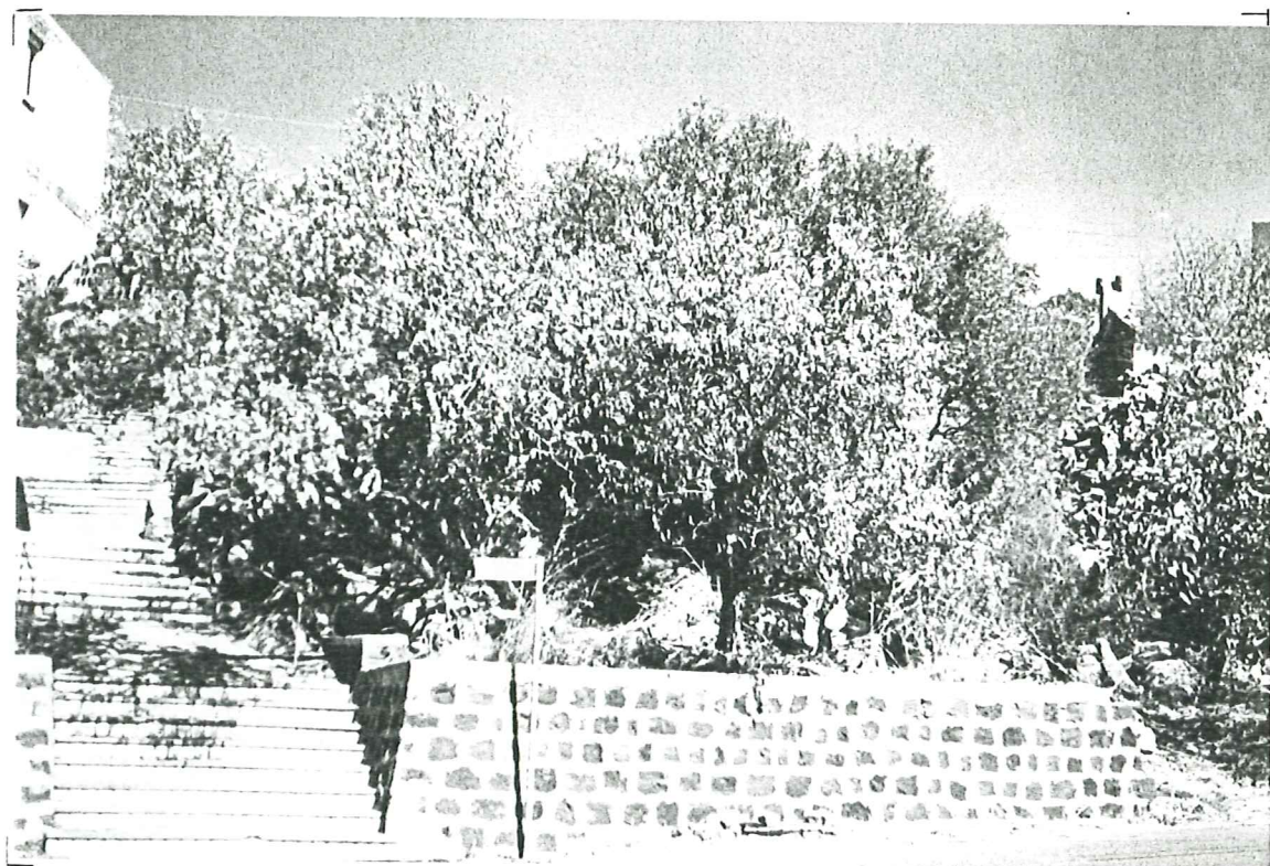
PROSPETTO SU VIA S. ANDREA unità a