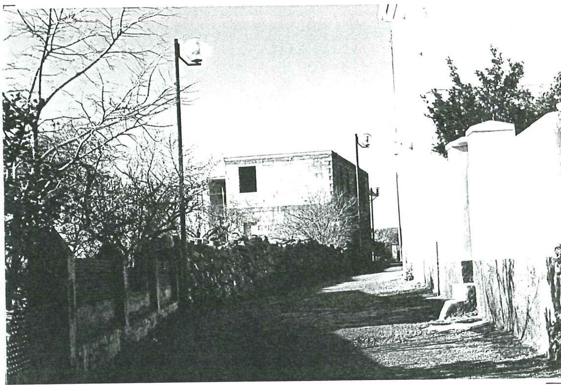
PROSPETTO SU VIA GALLIANO unità c - b