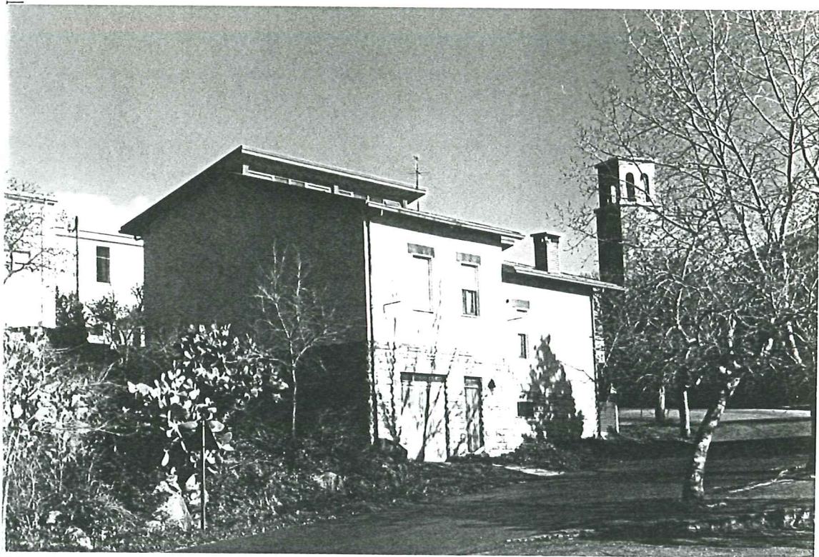
PROSPETTO SU VIA S. ANDREA unità b - c